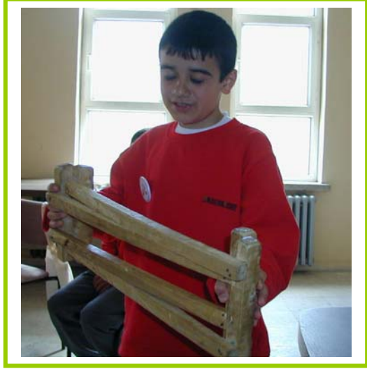
Etkinliklerden örnekler: Meyve salatası, Kendi Müzemizi Kuruyoruz