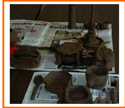
Seramik çamuru ile yapılmış çalışmalar