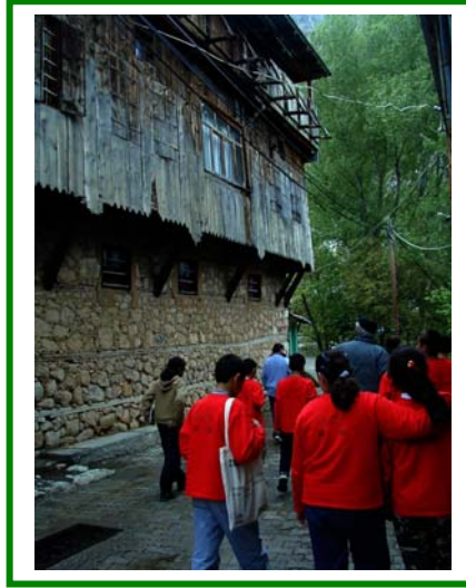
Gezilerden örnekler (saat yönünde): Kemaliye sokakları, Kemaliye müzesi, Demirci atölyesi